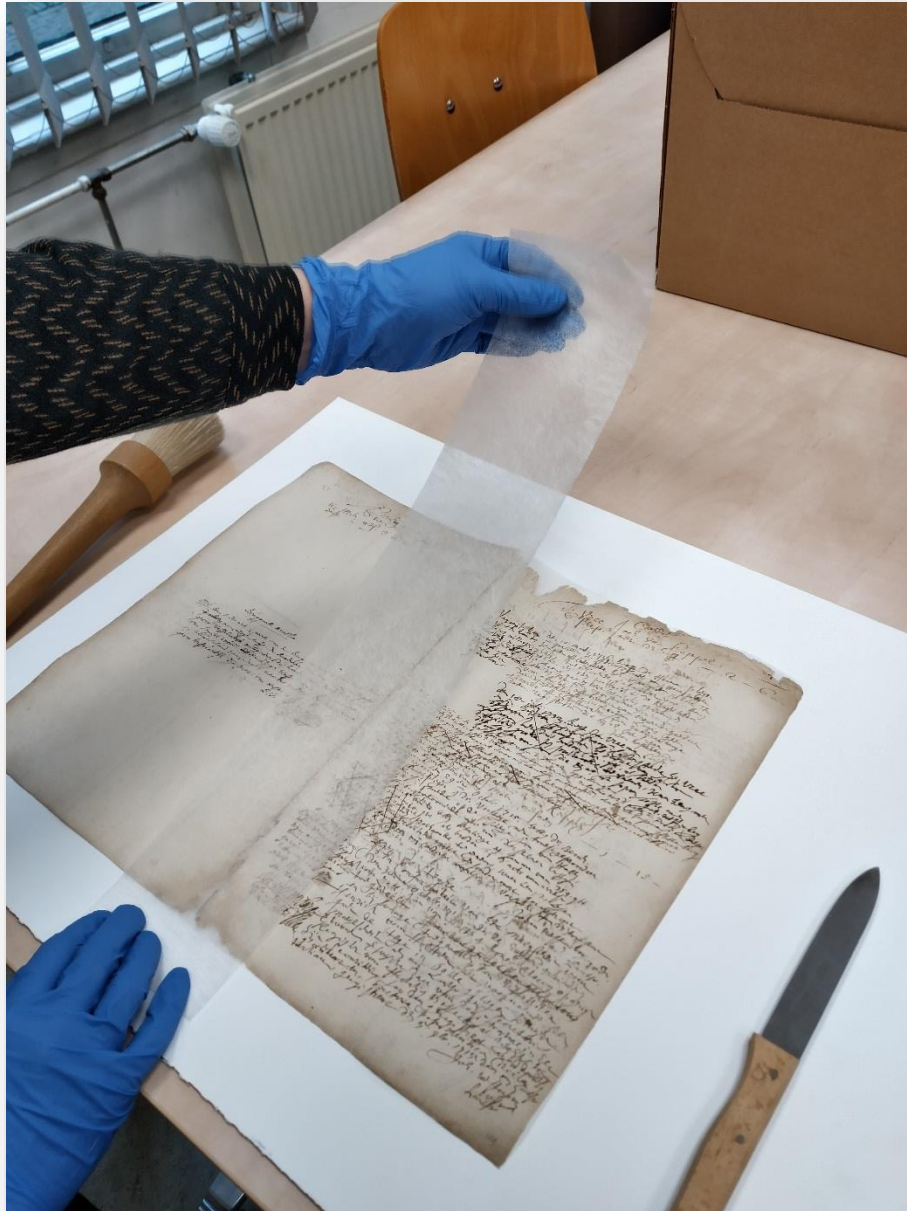
Zwakke delen van het papier worden verstevigd met dun Japans papier.