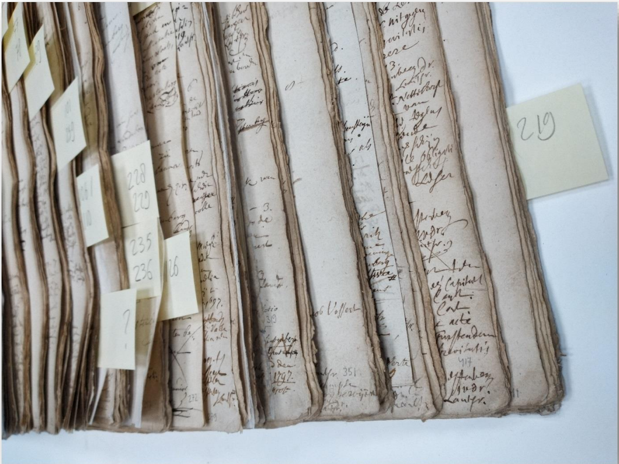
De pagina's van het boekblok worden na de papierrestauratie weer in de juiste volgorde gelegd.