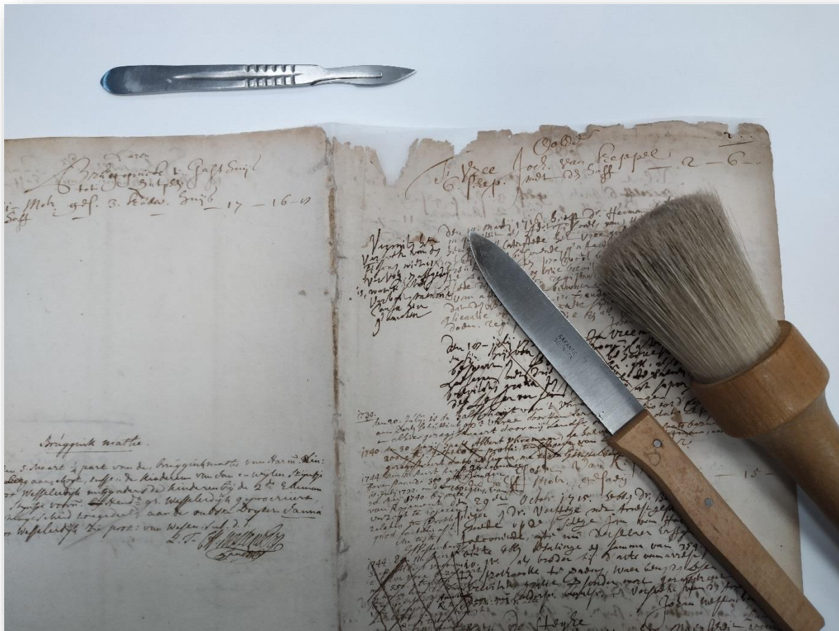
De gerestaureerde vellen papier worden bijgesneden.