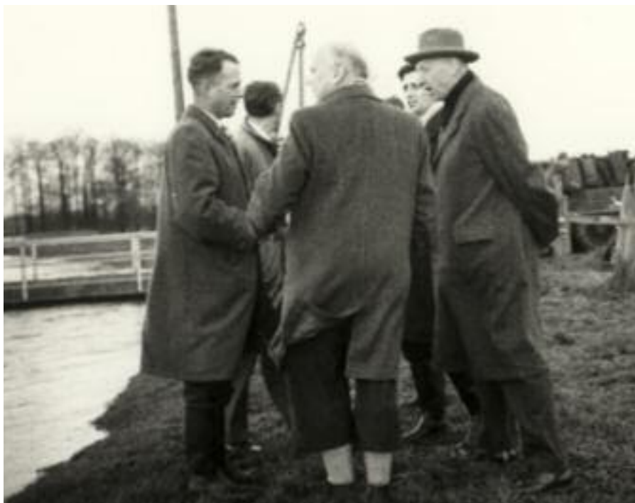
Schouw in de 60-er jaren

Er waren meerdere schouwvoeringen per jaar. In de archieven komen vele benamingen van schouwvoeringen voor, maar door de eeuwen heen zijn