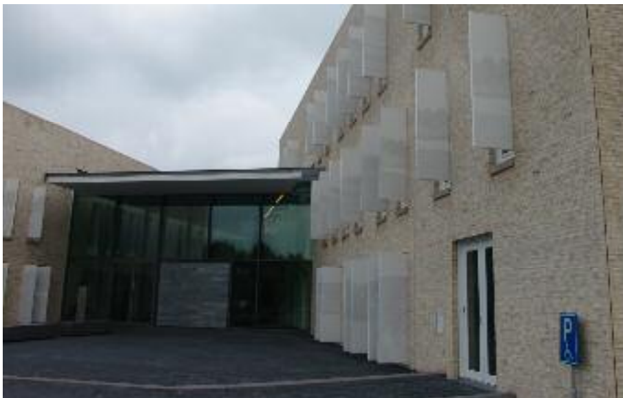
Het gemeentehuis van Bronckhorst

Een toegepast kunstwerk moest ik maken, dat zich manifesteert op 289 luiken verdeeld over alle gevels van het gebouw. Het dient zich terughoudend te gedragen - als een bescheiden melodie die de architectuur