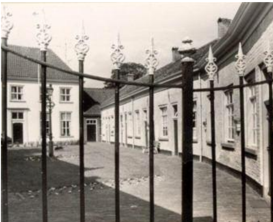
De gasthuiswoningen in Doesburg

De Gasthuiskerk en het hofje met de gasthuiswoningen zijn een bezienswaardigheid in het centrum van Doesburg. Het Gasthuis met zijn bezittingen wordt tegenwoordig beheerd door De Gestichten van Weldadigheid. De Gasthuishuisjes worden nog steeds bewoond. Ze zijn zeer in trek, maar van gemeenschappelijke maaltijden waar een gasthuisbewoner in de zestiende eeuw recht op had, is geen sprake meer. ■