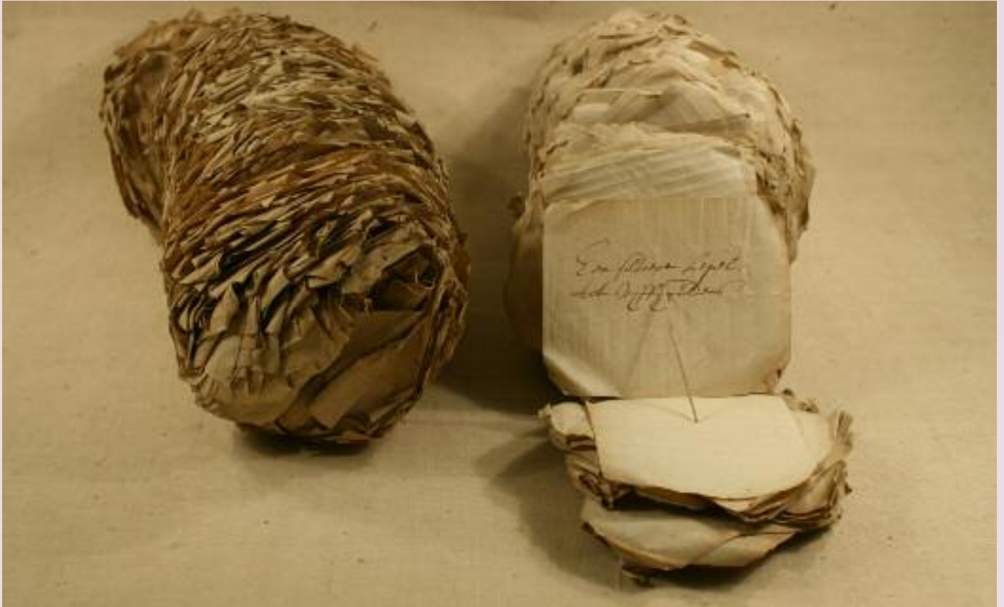
Voorbeeld van een lias: loterijbriefjes uit het oud-archief Doesburg

Tegenwoordig zijn er vele manieren om een bundel papier bij elkaar te houden. Een paar velletjes papier maken we aan elkaar vast met een nietje. Grote hoeveelheden worden voorzien van gaatjes met de perforator zodat ze gezamenlijk in een map gedaan kunnen worden.