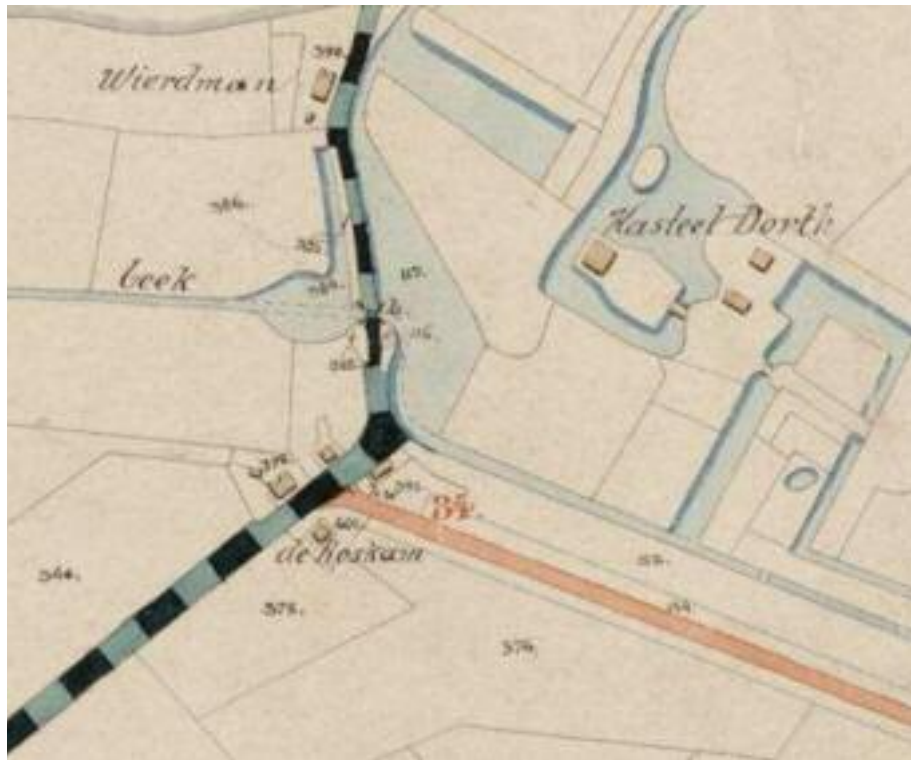
De Roskam op een kadastrale kaart uit 1889

Tot 1811 was de Kring van Dorth een (hoge) heerlijkheid; het was een zelfstandig gebied met eigen wetten, bestuurders en rechtspraak. In 1795 werd onder invloed van de Fransen een onderscheid gemaakt tussen bestuur en rechtspraak. Ook Kring van Dorth kreeg een eigen municipaliteit. Deze voorlopers van de huidige gemeenteraden werden in 1798 weer af-