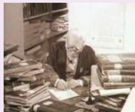
... met de stofjas.

De archivaris wordt niet met uitsterven bedreigd, hij of zij is getransformeerd tot informatiemanager. De archivaris met stofjas, muizenissen en muizenvalletjes is definitief in het Van Rappardmuseum bijgezet. ■