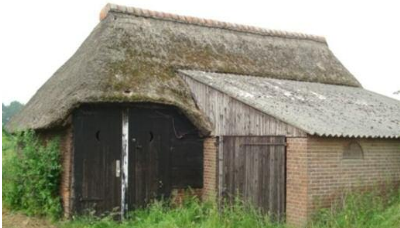
De schaapskooi. Foto: J. Knuvers, 2007

In 2008 heeft de gemeente onderzoek uitgevoerd naar het vroegere huis Wisch. De gemeente wil de schaapskooi op de gemeentelijke monumentenlijst zetten. Het waterschap was eerst niet zo blij met het bezit van een monument zonder enig waterschapsbelang, maar voortschrijdend inzicht en veranderd beleid heeft tot een andere kijk op het bezit van de schaapskooi geleid. Het waterschap koestert zijn kleine monument nu en werkt mee aan initiatieven om de schaapskooi onder de aandacht van een groter publiek te brengen. Het gebouwtje is van binnen (nog) niet te bezichtigen. ■