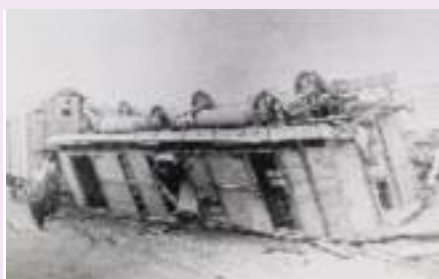
Omgeworpen treinwagon. Fotocollectie Groenlo 20-00051

In het archief van het gemeentebestuur van Neede bevinden zich meer stukken die betrekking hebben op de ramp van 1927.[3] Hieruit komt de omvang van de schade naar voren, dat