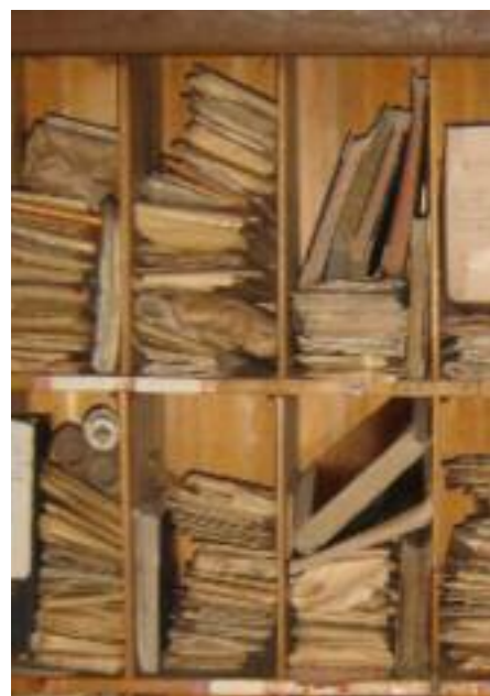
Archieven voordat ze worden overgedragen

[2] Uit de nota Archiefbeleid van de Minister van OC&W, 1985