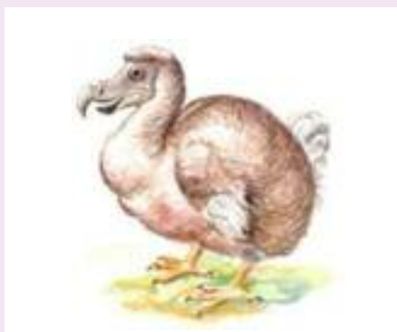
Zal het de archivaris net zo vergaan als de dodo?

zoeker op jaren, maar vanaf nu konden werkelijk massa's mensen hun stamboom zo via het internet bestuderen.